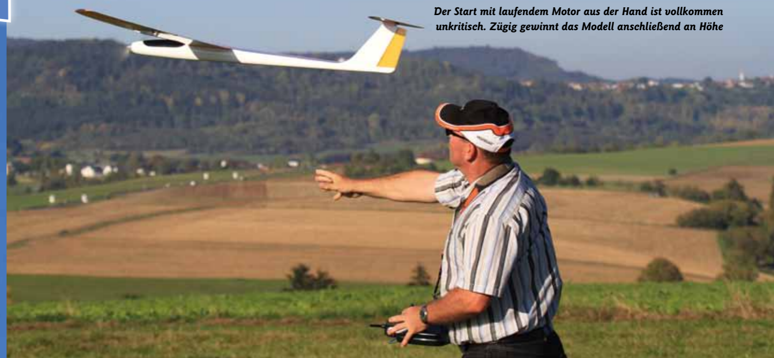
Der Start mit laufendem Motor aus der Hand ist vollkommen unkritisch. Zügig gewinnt das Modell anschließend an Höhe