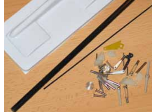
Dem Baukasten liegt ein hochwertiger und vollständiger Kleinteilesatz bei

Angesichts der hohen Vorfertigung fragt man sich, was es überhaupt noch zu tun gibt. Es sind auch nur noch ein paar Kleinigkeiten zu erledigen, zum Beispiel das Befestigen des Seitenruders mittels Stiftscharniere am Rumpf, die Montage des 1,2-mm-Stahldrahts im Bowdenzug oder