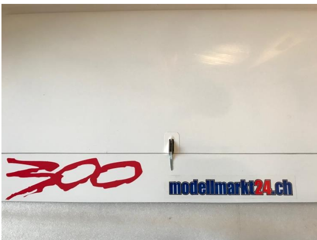
Fertiger Einbau Flügeloberseite

Damit es schön aussieht, habe ich die Öffnungen beim Clip mit passend geschnittener Selbstklebefolie weiss umrandet.