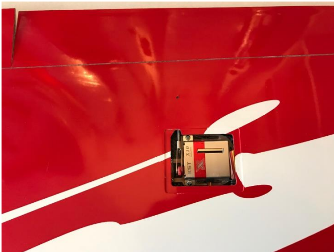
Einbau der Servos auf Flügelunterseite

Nicht vergessen, vor dem definitiven Einbau der Servos und Servohebel alles austesten und die Servomitte auf der Fernsteuerung auf Null stellen. Jetzt stellen wir die Anlenkungen ein, sodass die Servohebel und Klappen richtig stehen. Elektronische Verstellungen brauchen wir dann nur noch für die Feinjustierungen.