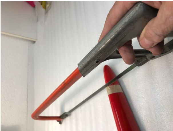
Beschnitt der Nase (60mm von Spitze)

Auch wenn's wehtut – jetzt muss die Nase weg. Wie das geht, hier die Bilder. Also: genaue Position festlegen (in meinem Fall 60 mm von Rumpfspitze aus), mit Abdeckband fixieren und dann beide Rohre (Innenrohr und Überrohr) miteinander kürzen.