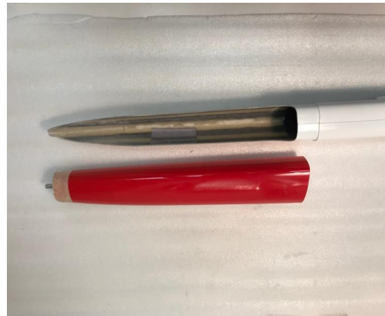
Beschnitt des Innenrohres Rumpfaussenrohr mit Motor