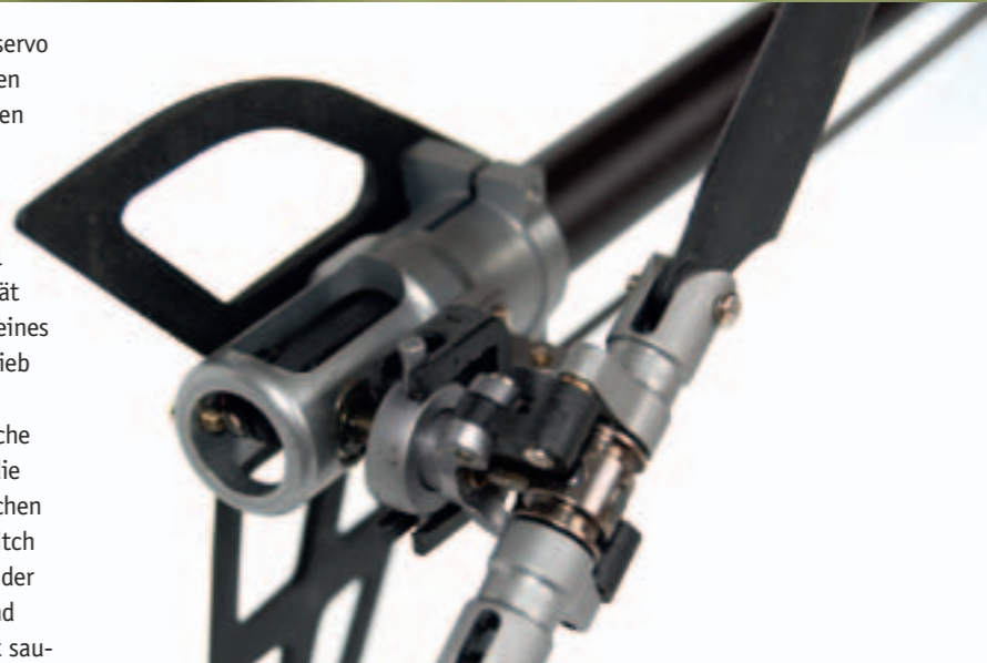
Am Heckrotor kommt ebenfalls größtenteils Aluminium zum Einsatz

Auf dem Flugfeld angekommen, sollte der 3D-Heli erstmals den Boden unter den Füßen verlieren. Beim Hochdrehen des Motors fiel sofort der absolut perfekte Blattspurlauf der Hauptrotorblätter auf, der dem oft zitierten Begriff „messerscharf“ total entsprach – die logische Folge einer Kombination aus perfekter Einstellung, Alu-Rotorkopf und CFK-Rotorblättern. Das Heck zeigte jedoch das erwartete, unerwünschte Verhalten: Im Normal-Modus des GY 192 drehte der Griffin recht kräftig um die Hochachse, entgegen der Drehrichtung des Hauptrotors. Da das Heckgestänge des Helis aus einer starren CFK-Stange besteht, die keinerlei Längen Anpassung zulässt, wurde kurzerhand