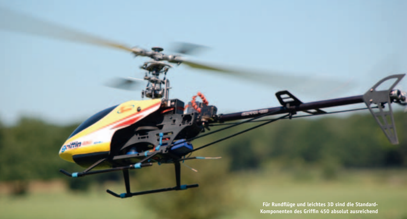
Für Rundflüge und leichtes 3D sind die Standard-Komponenten des Griffin 450 absolut ausreichend

eingestellt werden soll. Hierzu muss erst das Nickservo mitsamt Trägerplatte demontiert werden. Ansonsten hat man praktisch keine Chance, die zwei Schrauben zu erreichen, die den Motor an seiner Aluminium-Trägerplatte fixieren.