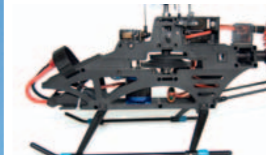
Der Grundaufbau basiert auf einem Chassis aus Kunststoff

Bord. Über ihre Platzierung muss man sich keine Gedanken mehr machen, denn der Griffin kommt vollständig vormontiert zu seinem neuen Besitzer. Basis des Helis ist ein Kunststoffchassis, in dem die genannten Bauteile möglichst nah am Schwerpunkt platziert wurden. Klassentypisch sorgen drei Servos für die kollektive und zyklische Verstellung der 120-Grad-Taumelscheibe. Um das Heck während des Flugs stets in der gewünschten Position zu halten, steuert ein viertes