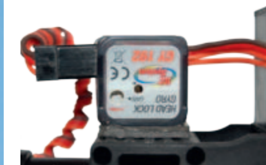
Ein GY 192 verleiht dem Heck die notwendige Stabilität