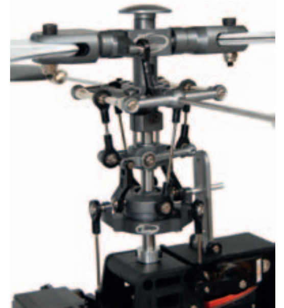
Viele gefräste Aluminiumteile bilden den Hauptrotorkopf und sorgen für ein präzises Flugverhalten

Insgesamt hinterlässt der Griffin 450 einen gelungenen Eindruck. Seine größten Schwächen liegen vor allem in der konstruktionsbedingt schlechten Erreichbarkeit einiger Bauteile, was Reparatur und Wartung unnötig in die Länge zieht. Dazu kommt noch das viel zu flache Landegestell, das den Heckrotor in arge Bedrängnis bringt. Doch die positiven Punkte überwiegen deutlich: Die präzise Fertigung von Haupt- und Heckrotor sowie das verwendete Material sind ein absolutes Highlight. Die Elektronik-Komponenten erwiesen sich zumindest für Rundflüge und leichte 3D-Einsätze als absolut angemessen, sodass sich ein stimmiges Gesamtpaket ergibt. Letztlich beantwortet der Griffin 450 die eingangs gestellte Frage, ob der Markt noch ein weiteres Modell der 450er-Klasse braucht, durch seine Fähigkeiten von selbst: Ein guter Heli zum moderaten Preis wird immer seine Freunde finden. <<