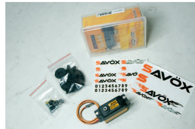
Der Lieferumfang umfasst neben dem üblichen Befestigungsmaterial sowie Hebeln auch einen Dekorbogen, mit dem man seine Servo-Vorliebe kundtun kann.

Neben den eigentlichen Akteuren der 20-mm-Standardgröße befanden sich in den stabilen Kunststoffkästen je ein Tütchen mit Befestigungsschrauben samt Hülsen und Dämpfungsgummis sowie zwei Savox-Dekorbögen. Zum Befestigen der Gestänge lagen