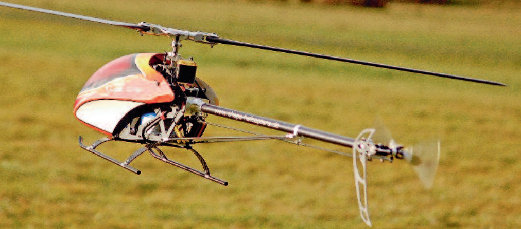
Während der Erprobung im Shape 9,0 glänzten die Savox-Stellwerker durch Stellgenauigkeit, knackiges Ansprechen und einen erstaunlich geringen Stromverbrauch.

Selbst wenn einige Punkte dieser Vorstellung immer subjektive Beobachtung anstelle wissenschaftlicher Erkenntnis bleiben werden, kann ich mit Fug und Recht behaupten, dass ich mit der gewählten Kombination aus den Savox SB-2271SG und SB-2272MG für einen 700er Heli überaus zufrieden bin. Sie erledigen zuverlässig ihre Arbeit und zeigen bisher keinerlei Anzeichen von Verschleiß. Die Frage, ob ich die Ausstattung so empfehlen kann, möchte ich mit einem überzeugten »Ja« beantworten.