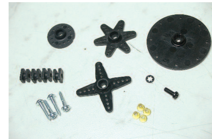
Es liegen zwei unterschiedlich große Servoscheiben sowie ein vier- und ein sechssar-miger Sternhebel bei. Das Befestigungsmaterial entspricht ebenfalls dem Standard.

neben einem Kreuz- und einem Sechsfach-Servoarm auch zwei Servoscheiben unterschiedlicher Größe bei. Die Aufnahmen am Zahnkranz (25 Zähne) entsprechen der »Futaba-Norm«, so dass alle von bzw. für Futaba hergestellten Servoarme ebenfalls verwendet werden können. Die Befestigung der Hebel erfolgt mit M3-Schrauben samt Sicherungsringen. Da servoseitig das Gewinde ebenfalls aus Metall besteht, empfiehlt es sich übrigens, bei der endgültigen Montage eine Schraubensicherung zu verwenden.