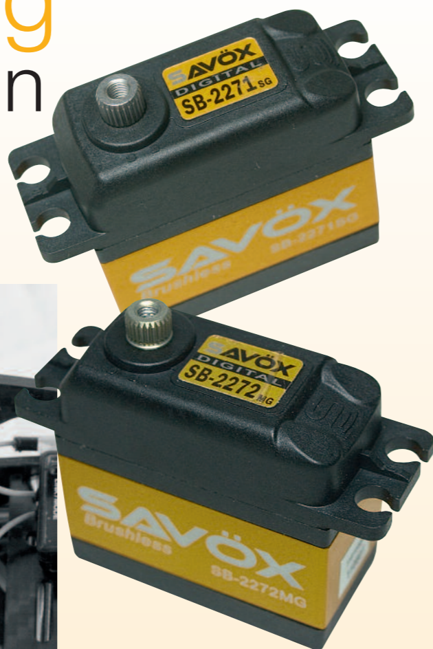
Die Brushless-HV-Servos SB-2271SG und SB-2272MG machen durch das farbig eloxierte Aluminium-Gehäuseteil auch optisch eine gute Figur.